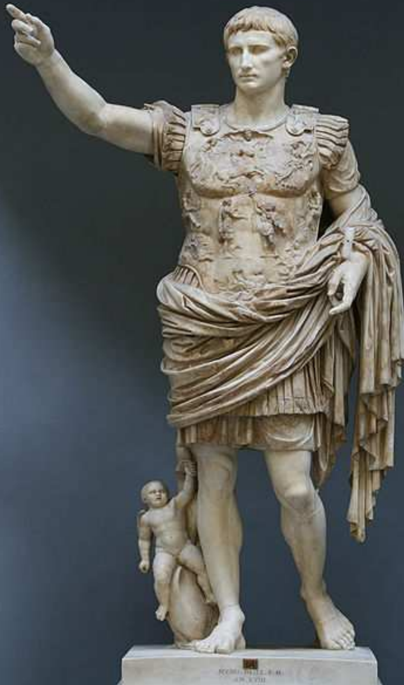
Statue d'Auguste de Prima Porta, 1er siècle Marbre, 206 cm Rome, musée du Vatican