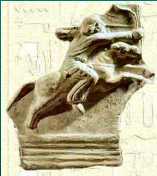
Chevalier Parthe, Turin - Italie

La défaite de Carrhae (Syrie) en 53 avant JC avait laissé des traces profondes dans l'orgueil romain : le triumvir Crassus y avait laissé la vie, mais pire que tout, les enseignes romaines avaient été capturées par l'ennemi. Cette restitution qu'Auguste venait d'obtenir par la voie diplomatique lavait trente ans d'humiliation face aux peuples d'Asie.