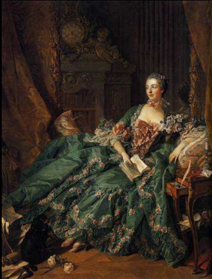
La marquise de Pompadour peinte par François Boucher en robe de Cour