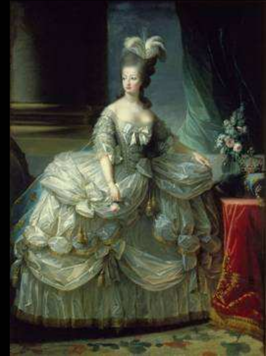
La reine Marie-Antoinette, par Elisabeth Vigée-Lebrun