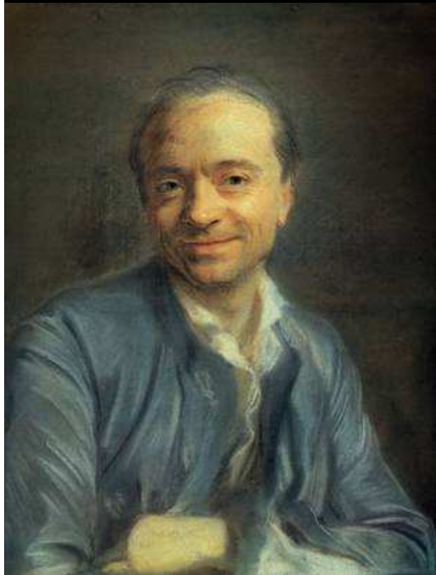
Autoportrait, De La Tour