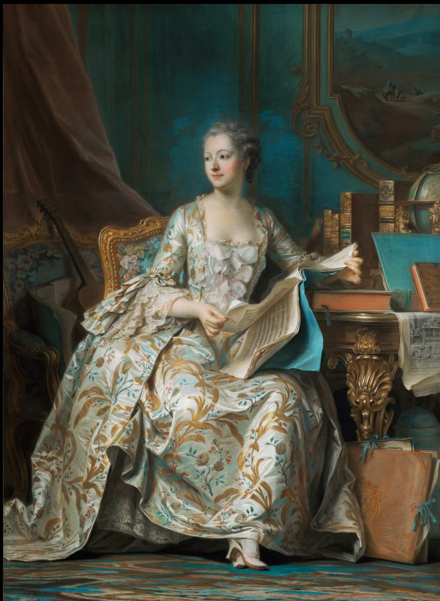
Maurice Quentin DE LA TOUR (1704, 1788) La Marquise de Pompadour, 1775 Pastel avec rehauts de gouache sur papier gris-bleu marouflé sur toile, 175x128cm Paris, musée du Louvre