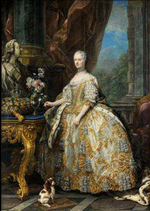
La reine Marie Leszczyńska, par Van Loo