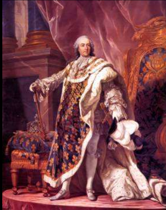
Le roi Louis XV, par Van Loo