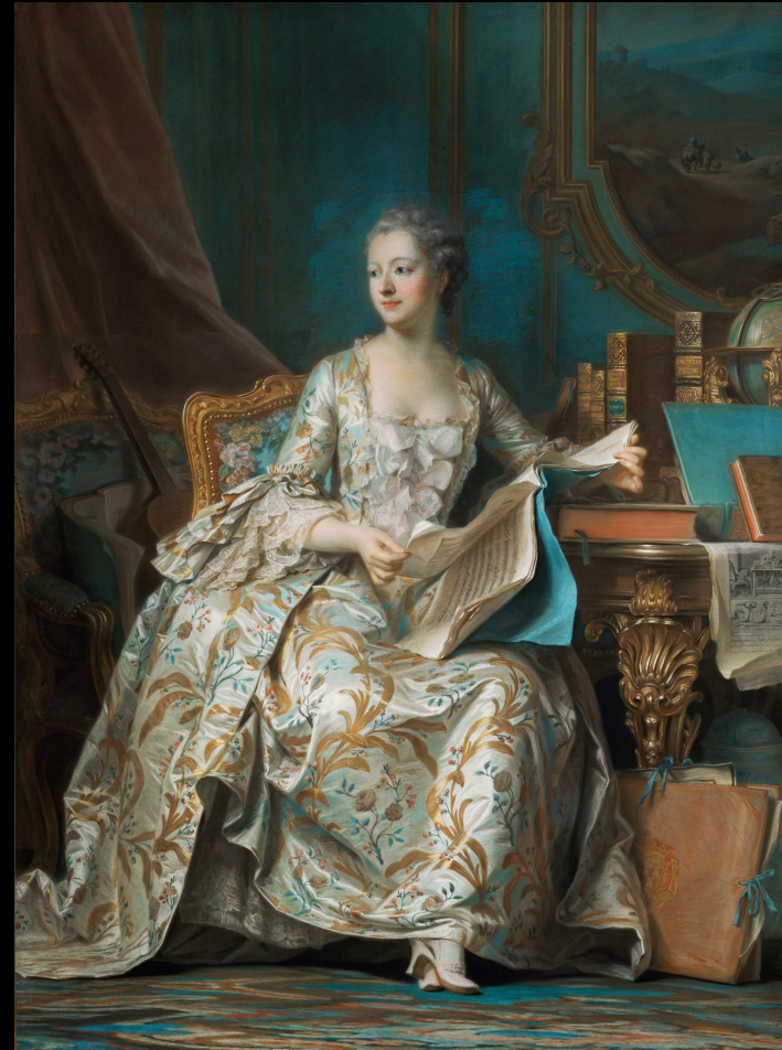
La marquise de Pompadour par Maurice Quentin de La Tour en robe d'intérieur