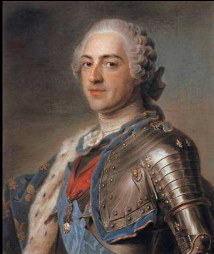
Louis XV, De La Tour